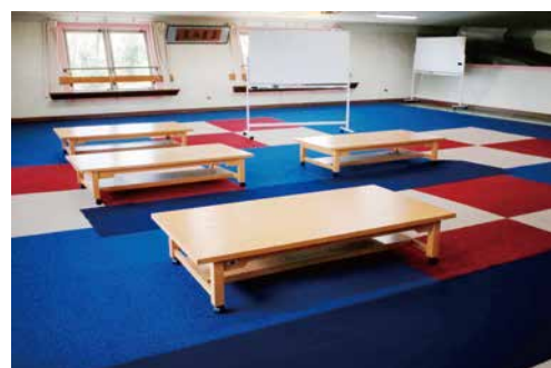
広々としたお教室で稽古します