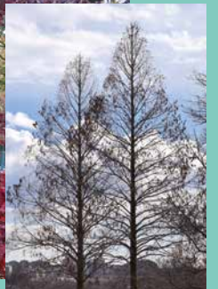
メタセコイアの冬木立