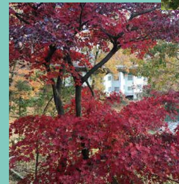
秋色に染まる木々と松下館