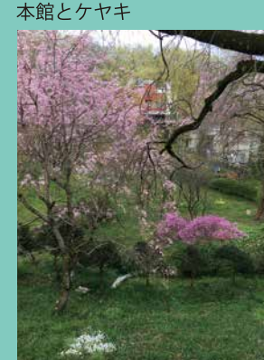
早春の枝垂れ桜とミツバツツジ