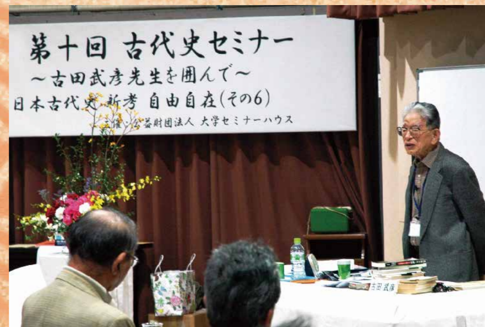
2013年第十回古代史セミナー