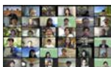
第3回アメリカセミナー

※ 2020年度予定されていた「憲法を学問するV」「第9回 EU セミナー」「世界の中の中国と日本 現代中国理解III」は、コロナ禍のなか、やむなく非開催となりました。