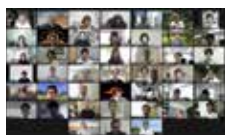
第11回新任教員セミナー