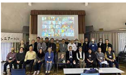
古田武彦記念古代史セミナー 2020