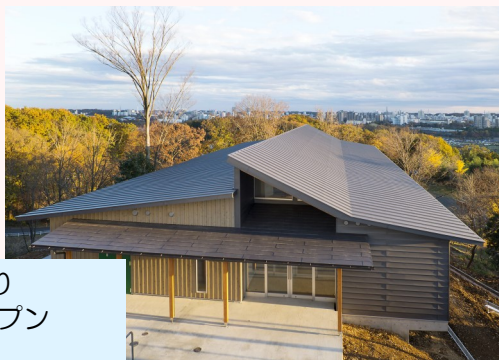
Dining Hallやまゆり 2016年11月オープン

富士山を望む朝の清々しい空気の中で朝食を召し上がっていただけます ☆朝食はビュッフェ形式になります