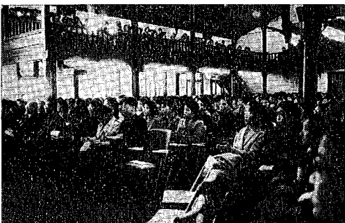
講演会(於日本女子大学成瀬記念講堂)

院大学・成蹊大学・東京女子大学・明治学院大学・武蔵工業大学・津田塾大学・順天堂大学・上智大学・国学院大学・東洋大学・専修大学・立正大学・日本医科大学・玉川大学・武蔵大学・東京経済大学・東京女子医科大学・東京家政大学・昭和薬科大学・駒沢大学・東京農業大学・共立薬科大学・相模女子大学・東京理科大学・芝浦工業大学・共立女子大学・女子美術大学・和洋女子大学・昭和女子大学・実践女子大学・国際基督教大学・亜細亜大学・成城大学・日本社会事業大学・東京慈恵会医科大学・工学院大学・星薬科大学・東京電機大学・桐朋学園大学・麗沢大学・国士館大学・千葉商科大学・神奈川大学・千葉工業大学