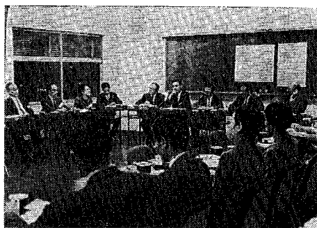
セミナー（於国立教育会館）