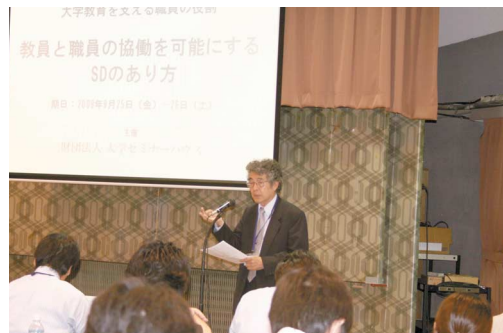
▲第21回大学職員セミナー