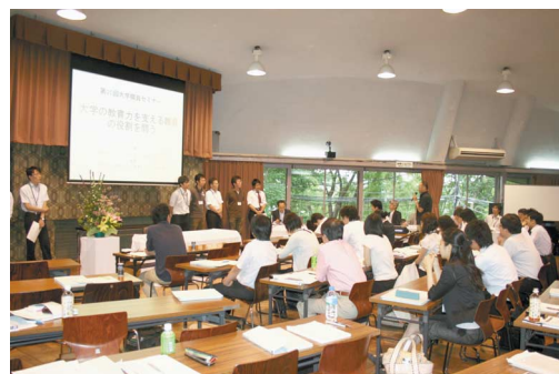
▲第20回大学職員セミナー