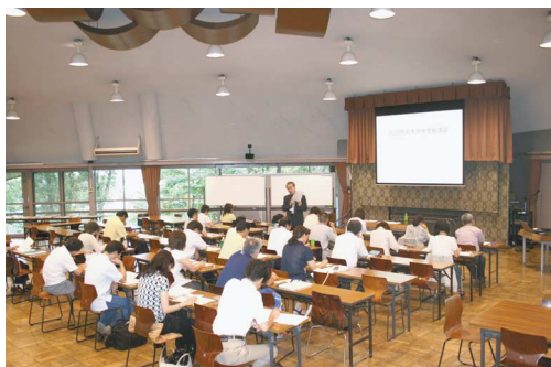
▲第3回教員免許状更新講習